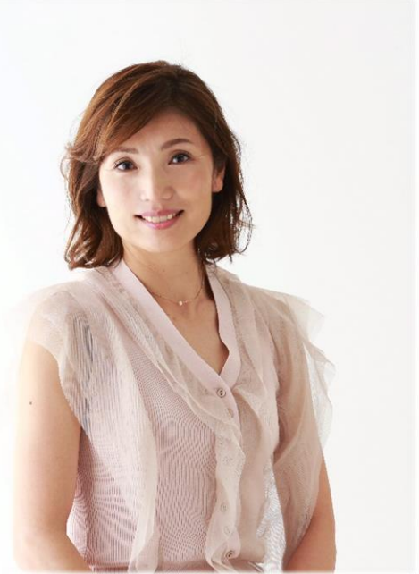
武田美保さん プロフィール

千葉県ユニセフ協会は 2024 年設立 20 周年を迎えました。今年の「ユニセフのつどい」は、武田美保さんをゲストにお迎えし、『子どもたちの笑顔のために』を演題にお話しいただきます。講演会後は、参加者全員で「ボッチャ」を体験。人と人とのつながりの大切さや楽しさをみんなで共有し、世界の子どもたちへの支援の輪を広げていきましょう。子どもから大人まで、多くの方と設立 20 周年をお祝いしたいと思います。お申し込みお待ちしております。